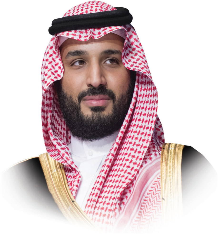
صاحب السمو الملكي الأمير محمد بن سلمان بن عبدالعزيز ولي العهد حفظه الله ورعاه