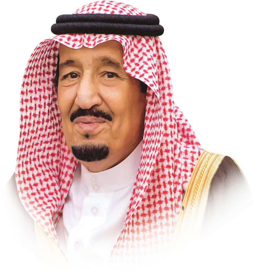
خادم الحرمين الشريفين الملك سلمان بن عبدالعزيز حفظه الله ورعاه